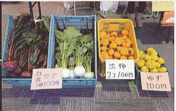
地元フラスタジオによるフラダンスあり! 地元産の新鮮野菜販売あり!